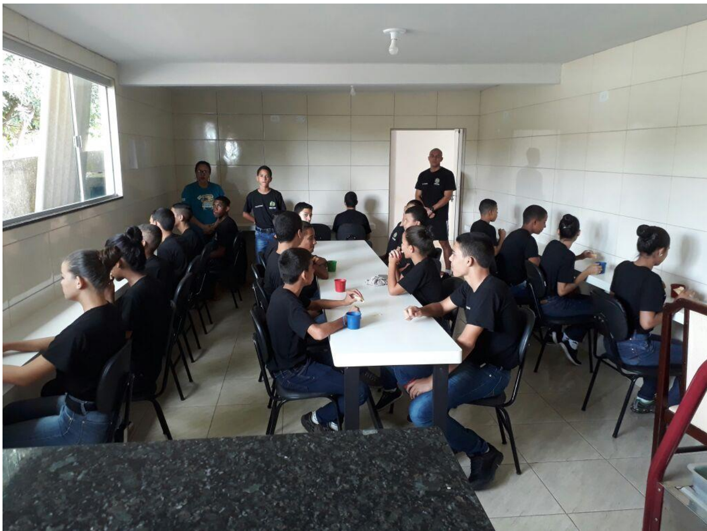
O Refeitório oferece todas as alimentações, incluindo café da manhã, almoço e lanche à tarde.